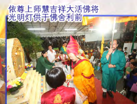
依尊上师慧吉祥大活佛将光明灯供于佛舍利前