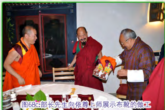
图68c:部长先生向依尊上师展示布靴的做工