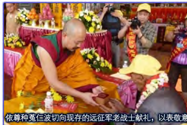
依尊种菟仁波切向现存的远征军老战士敬礼，以表敬意