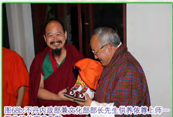
图68b:不丹内政部兼文化部部长先生供养依尊上师一双传统的不丹布靴