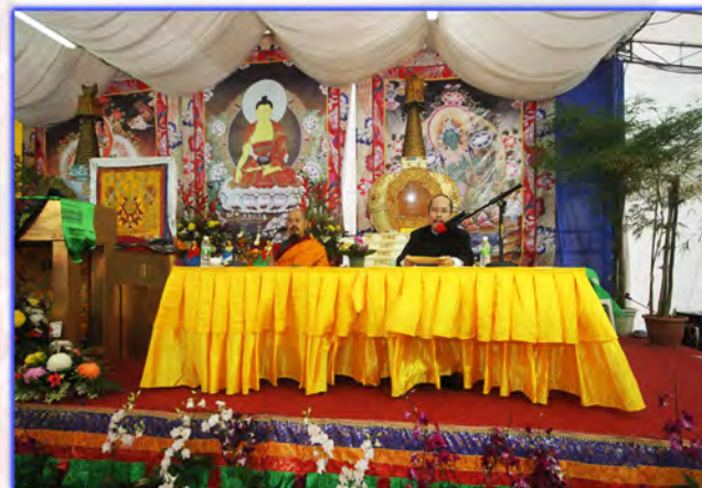
依尊上师慧吉祥大活佛和他的弟子给信众开示关于世界末日的话题，吸引了众多听众，大家都受益非浅。