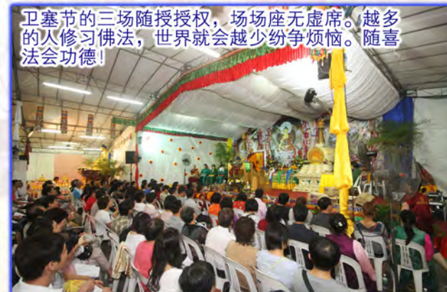
卫塞节的三场随授授权，场场座无虚席。越多的人修习佛法，世界就会越少纷争烦恼。随喜法会功德！