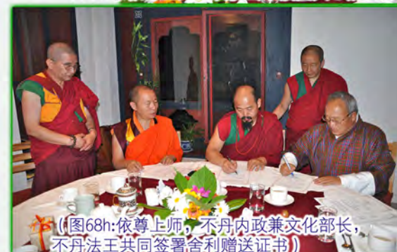
（图68h:依尊上师，不丹内政兼文化部长，不丹法王共同签署舍利赠送证书）