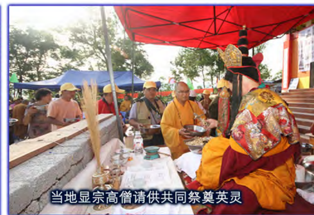
当地显宗高僧请供共同祭奠英灵