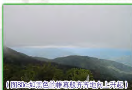
（图80c:如黑色的帷幕般齐齐地向上升起）

我们常说圣者的莅临可以带来吉祥，眼前的改变就是对这句话的诠释。它可以令人增加对圣者的信心，进而愿意接近并聆听圣者的教导，这也是瑞相的作用之一。