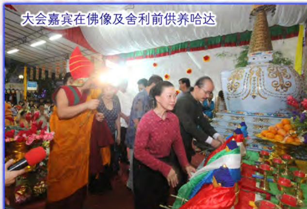
大会嘉宾在佛像及舍利前供养哈达