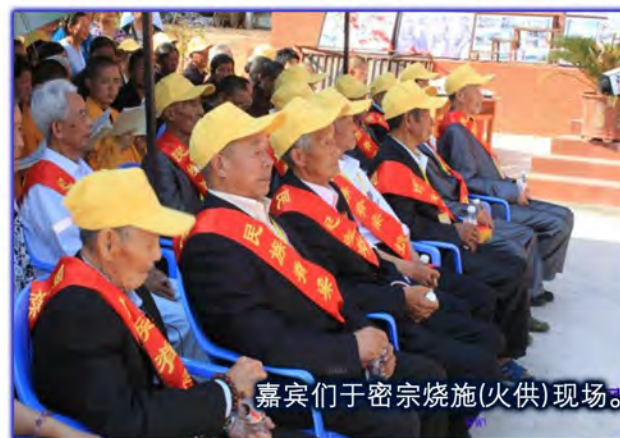
嘉宾们于密宗烧施(火供)现场。