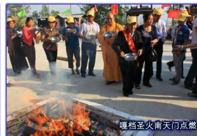
暖档圣火南天门点燃