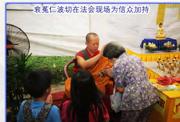
袞菟仁波切在法会现场为信众加持