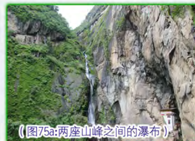
（图75a：两座山峰之间的瀑布）

在两座山峰之间有一条瀑布，水流地很急，声量也很大。有一座小桥跨过瀑布，把两边连起来。站在桥上，可以感觉到凉凉的水珠跳到脸上来，这让走了3个小时山路的人能感觉到一丝的轻松快乐。依尊上师带着大家把宝袋供入桥下的流水中，让这份来自圣者续的加持，以流水为载体，加持这块被用心保护着的土地，加持生活在这片土地上善良，淳朴，温和而又自信的不丹人（图75）。