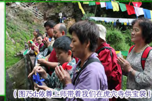
（图75d：依尊上师带着我们在虎穴寺供宝袋）