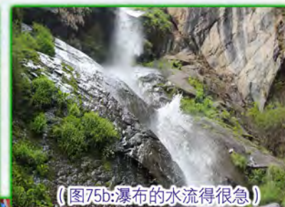
（图75b：瀑布的水流得很急）