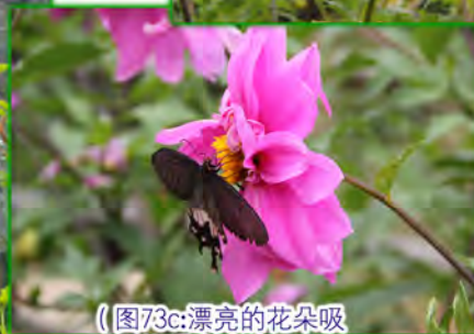
（图73c：漂亮的花朵吸引到蝴蝶也来光顾）