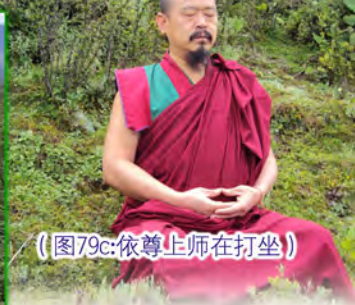
（图79c:依尊上师在打坐）