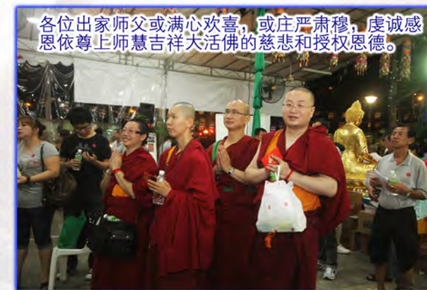
各位出家师父或满心欢喜，或庄严肃穆，虔诚感恩依尊上师慧吉祥大活佛的慈悲和授权恩德。