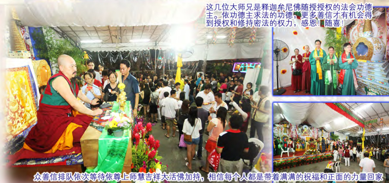
众善信排队依次等待依尊上师慧吉祥大活佛加持，相信每个人都是带着满满的祝福和正面的力量回家。