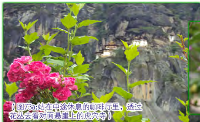
（图73a：站在中途休息的咖啡厅里，透过花丛去看对面悬崖上的虎穴寺）

上山的途中有一间咖啡厅，你可以在这里用餐，喝水，稍作休息。庭院里开着不同的花，从花梢上眺望对面悬崖上的虎穴寺，又是另一番风景（图73）。