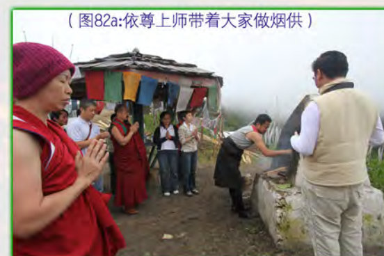
（图82a:依尊上师带着大家做烟供）