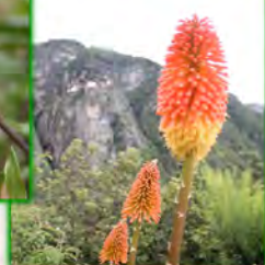
（图73d：庭院里长着各类不同的花草）

今天刚好是周末，一路上也遇到几位不丹人，有些来自首都廷布。他们都会讲些英文，而且脸上总带着友善的笑容，也喜欢和游客打招呼，简单地沟通几句。