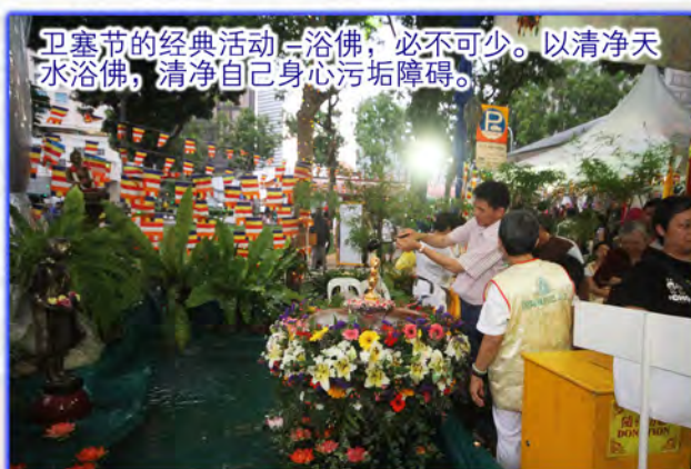
卫塞节的经典活动——浴佛，必不可少。以清净水浴佛，清净自己身心污垢障碍。