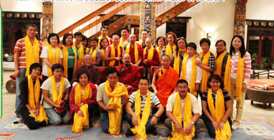
（图68m:依尊上师，部长先生及尊贵的崔钦彻林仁波切与大家合影）