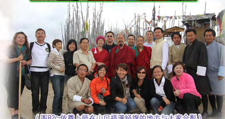
（图82c:依尊上师在山口插满经旗的地方与大家合影）

午餐过后，依尊上师又带着大家做了一次烟供，开示烟供的利益，并做广大的回向。我走过去问导游，想不想和仁波切合影呀？他们先是紧张地问我：“可以吗？我们可以有这个会吗？”在不丹，仁波切有很高的地位，是大家恭敬的对象。几天下来，依尊上师的举动他们都看到了—亲自给大家买水果，亲自洗干净，还要亲自送到每一个人的手里，自己先选玉米，再自己把烤好的玉米分给每个人…，如此亲切的仁波切，他们恐怕是第一次遇到。当几个男生知道可以和仁波切合影时，都赶紧整理自己的衣服，毕恭毕敬地上前站在依尊上师的身边。之后，在插满经旗的地方，依尊上师又和大家合影（图82）。