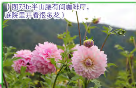
（图73b：半山腰有间咖啡厅，庭院里开着很多花）