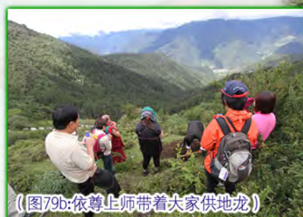
（图79b:依尊上师带着大家供地龙）

我们先在山口的一侧供地龙。过后，依尊上师带着大家在山坡上打坐（图79），我则忙着准备下一个供地龙要用的宝袋。