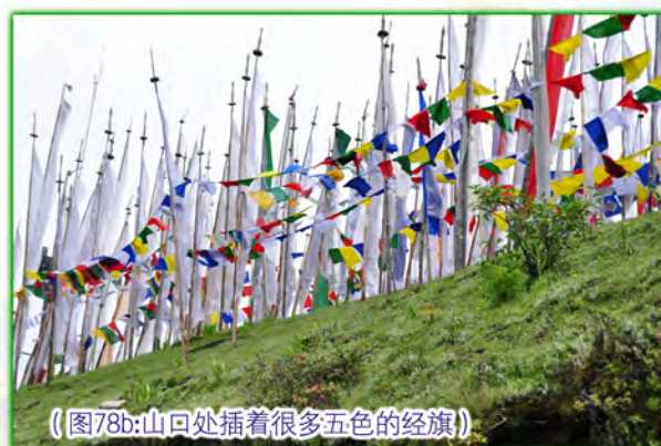
（图78b:山口处插着很多五色的经旗）

我们先在山口的一侧供地龙。过后，依尊上师带着大家在山坡上打坐（图79），我则忙着准备下一个供地龙要用的宝袋。