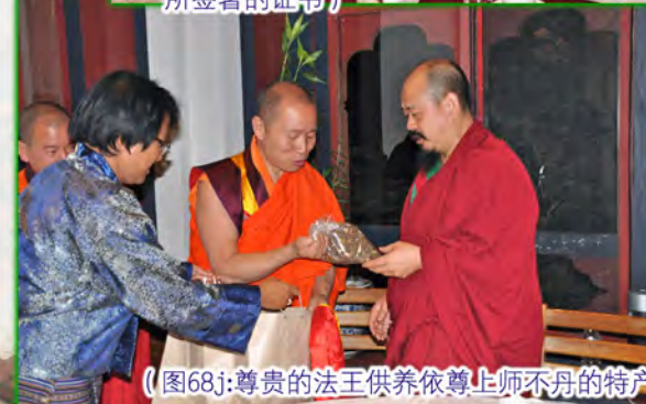
（图68j:尊贵的法王供养依尊上师不丹的特产）