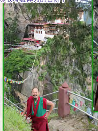
（图74b：依尊上师身旁就是那很考验体力的台阶）

走了2个多小时，我们终于到了虎穴寺对面的山峰，从这里开始是台阶。走到这，我已经很累了，虽然虎穴寺就在眼前，可以很清楚地看到它了，但要想进去，必须再走过这上上下下几百个台阶（图74）。平时走几个台阶不觉得什么，但此时再让你走走，就没那么轻松了。看来走台阶的感觉也是没有自性的，是缘起的。