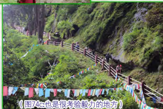
（图74c：也是很考验毅力的地方）

在两座山峰之间有一条瀑布，水流地很急，声量也很大。有一座小桥跨过瀑布，把两边连起来。站在桥上，可以感觉到凉凉的水珠跳到脸上来，这让走了3个小时山路的人能感觉到一丝的轻松快乐。依尊上师带着大家把宝袋供入桥下的流水中，让这份来自圣者续的加持，以流水为载体，加持这块被用心保护着的土地，加持生活在这片土地上善良，淳朴，温和而又自信的不丹人（图75）。