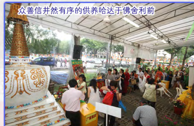
众善信井然有序的供养哈达于佛舍利前