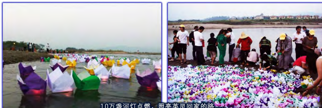
10万盏河灯点燃，照亮英灵回家的路……