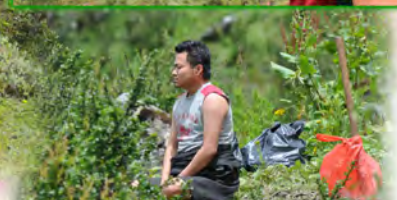
（图79d:我们的导游也在静坐）

山口的另一侧被乌云笼罩着，依尊上师选好了地点，我们就马上开始第二次供地龙。就在我们刚刚供完的当儿，天空开始改变了。刚才的乌云就像一块黑色的帷幕，缓缓地，齐齐地向上升起，大地瞬间变得清晰明亮（图80）。