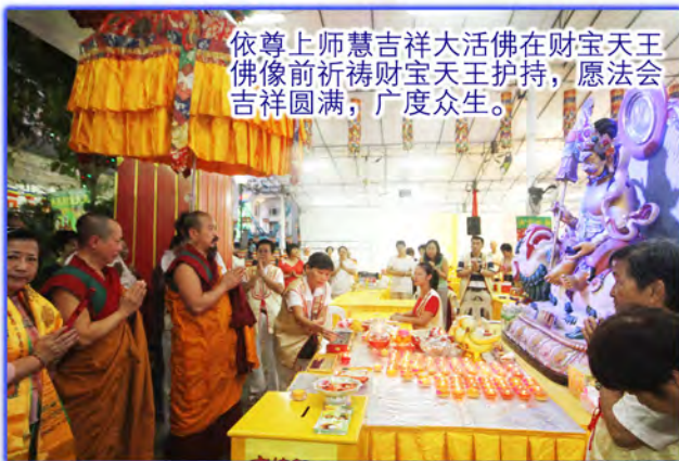
依尊上师慧吉祥大活佛在财宝天王佛像前祈祷财宝天王护持，愿法会吉祥圆满，广度众生。