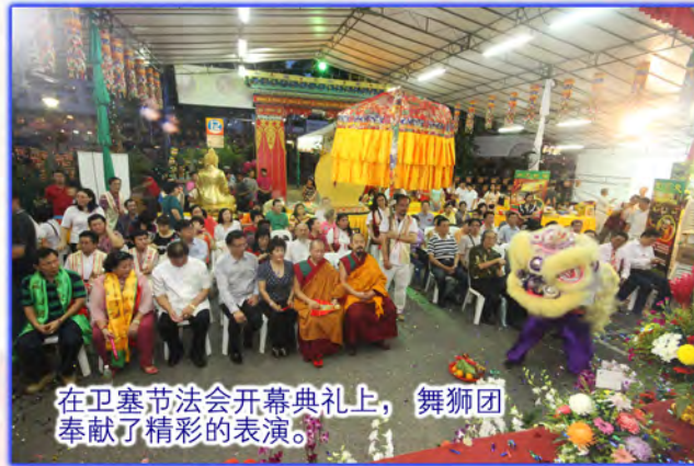
在卫塞节法会开幕典礼上，舞狮团奉献了精彩的表演。