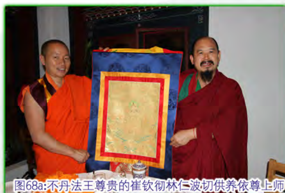
图68a:不丹法王尊贵的崔钦彻林仁波切供养依尊上师精美的唐卡