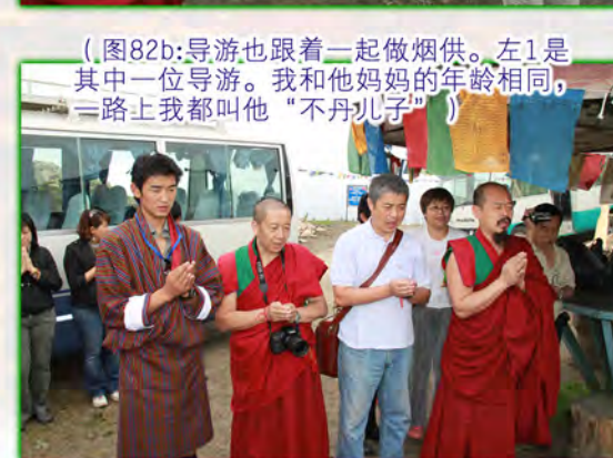
（图82b:导游也跟着一起做烟供。左1是其中一位导游。我和他妈妈的年龄相同，一路上我都叫他“不丹儿子”）