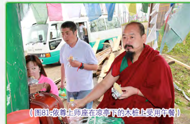
（图81:依尊上师座在凉亭下的木桩上受用午餐）

今天的午餐就在Chele La山口上享受。细心的导游准备了三明治，水果，还有茶和咖啡。依尊上师就座在山口凉亭下的木桩上，一边开示我们，一边享用午餐。依尊上师说“咖啡不错”，又喝了一口，然后说了一句“阿呼玛哈苏卡”（图81）。