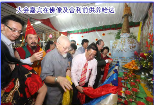
大会嘉宾在佛像及舍利前供养哈达