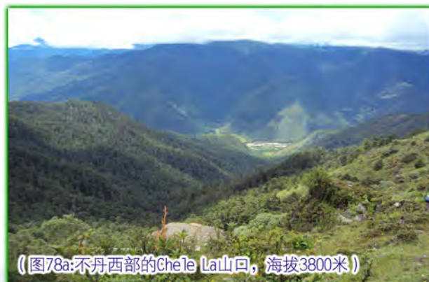
（图78a:不丹西部的Chele La山口，海拔3800米）

今天我们要去的景点是Chele La山口，位于Haa谷和Paro谷之间，海拔接近四千米，也是不丹西部最高点。站在Chele La山口，可以俯瞰周围的群山及村镇，欣赏着由高高竖起五色旗所呈现的另一番风景（图78）。