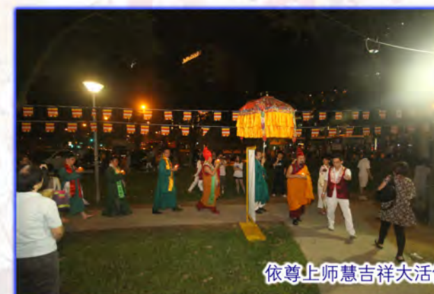
依尊上师慧吉祥大活佛带领信众进行传灯祈福仪式。