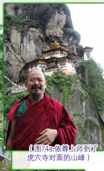
（图74a：依尊上师到了虎穴寺对面的山峰）