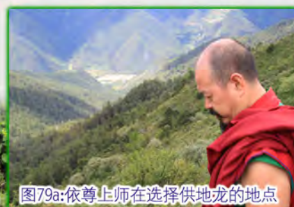
图79a:依尊上师在选择供地龙的地点