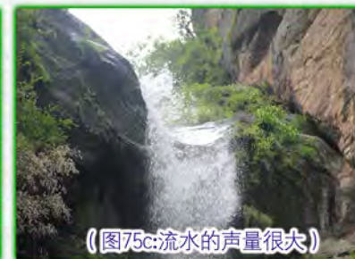
（图75c：流水的声量很大）