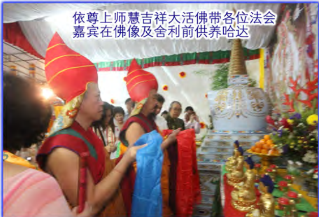
依尊上师慧吉祥大活佛带各位法会嘉宾在佛像及舍利前供养哈达