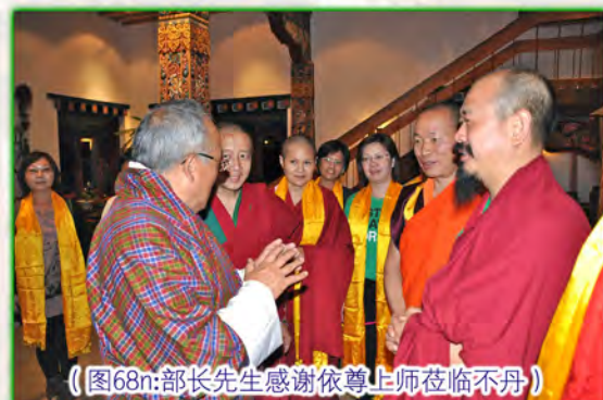
（图68g:部长先生感谢依尊上师莅临不丹）