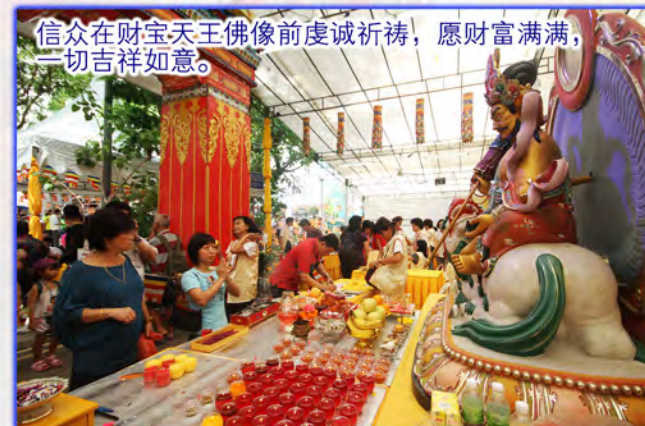
信众在财宝天王佛像前虔诚祈祷，愿财富满满，一切吉祥如意。