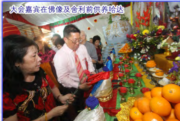
大会嘉宾在佛像及舍利前供养哈达