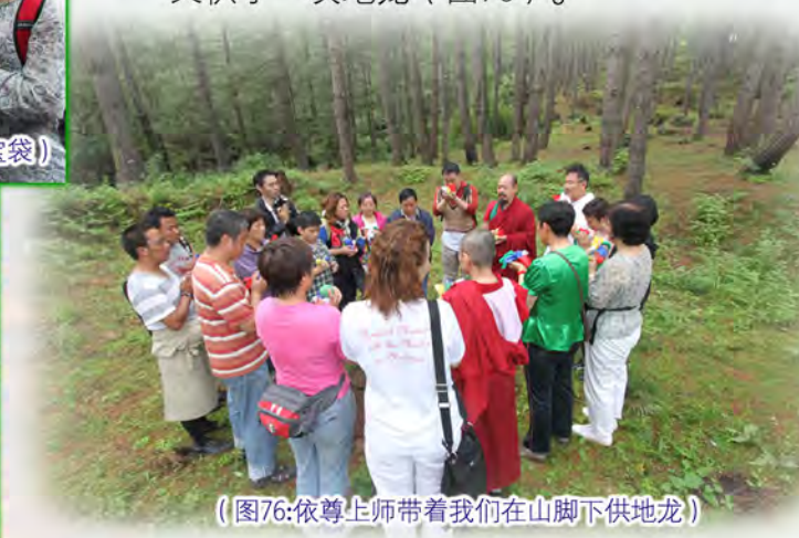
（图76：依尊上师带着我们在山脚下供地龙）

下山比较快。我们在山脚下，一块看上去很像聚宝盆的凹地处，由依尊上师带着，又供了一次地龙（图76）。