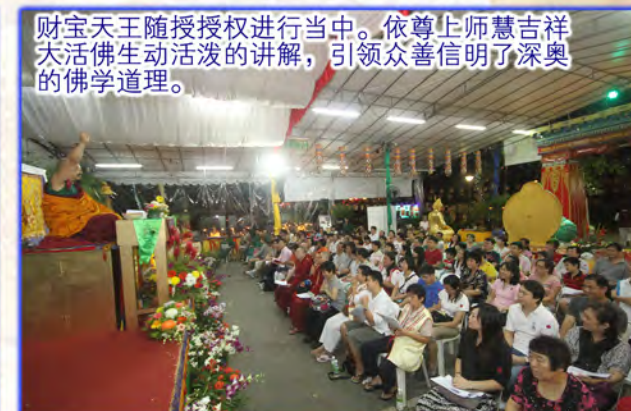
财宝天王随授授权进行当中。依尊上师慧吉祥大活佛生动活泼的讲解，引领众善信明了深奥的佛学道理。