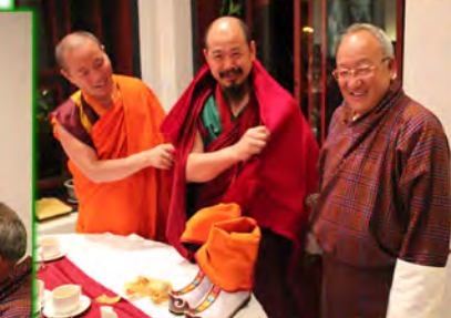
（图68g:依尊上师在欢悦当中接受具心的供养）