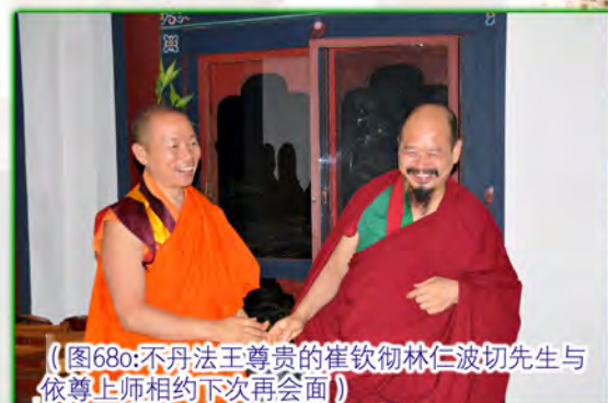
（图68h:不丹法王尊贵的崔钦彻林仁波切先生与依尊上师相约下次再会面）