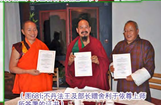
（图68i:不丹法王及部长赠舍利于依尊上师所签署的证书）