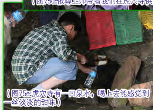
（图75e：虎穴寺有一口泉水，喝上去能感觉到一丝淡淡的甜味）

下山比较快。我们在山脚下，一块看上去很像聚宝盆的凹地处，由依尊上师带着，又供了一次地龙（图76）。