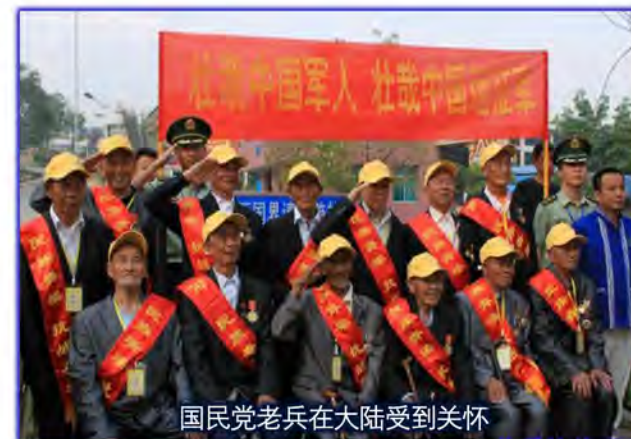
国民党老兵在大陆受到关怀