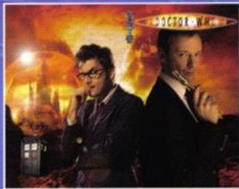
Retailer Incentive Wraparound Photo Cover