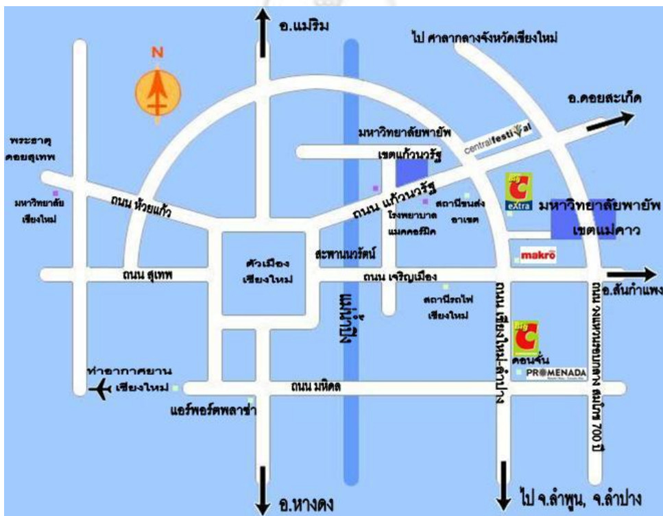
แผนที่มหาวิทยาลัยพายัพ

มหาวิทยาลัยพายัพ ได้สร้างหอพักนักศึกษาของมหาวิทยาลัย ในบริเวณเขตแม่คำว คือ หอพักหญิงอัลฟา และหอพักชายโอเมกา โดยใช้งบประมาณทั้งสิ้นประมาณ 300 ล้านบาท สำหรับรองรับนักศึกษาชั้นปีที่ 1 ได้ประมาณ 1,500 คน ซึ่งจะเป็นหอพักที่มีมา มาตรฐาน สะอาด ปลอดภัย โดยมีผู้ดูแลนักศึกษาอย่างใกล้ชิด ที่จะคอยปลูกฝังคุณธรรมจริยธรรมที่ดี และบ้านพักนานาชาติกราดราภาพ สำหรับนักศึกษานานาชาติ โดยเปิดโอกาสให้นักศึกษาไทยได้ใช้ชีวิตอยู่ร่วมกับนักศึกษาต่างชาติ เพื่อแลกเปลี่ยนเรียนรู้ภาษา และวัฒนธรรมที่หลากหลาย บริเวณเขตแก่นนบุรี มีหอพักนักศึกษาคณะพยาบาลศาสตร์แมคคอร์มิค และหอพักนักศึกษาวิทยาลัยพระคริสตธรรมแมคกิลลารี