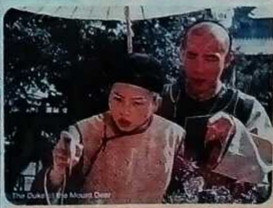
The Duke of the Mount Deer