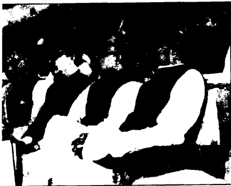
বঙ্গবন্ধুর পাশে সৈয়দ নজরুল ইসলাম, তাজউদ্দীন আহমদ ও এম. মনসুর আলী

হত্যাকাণ্ডের মধ্যে দিয়ে রাজনৈতিক পটপরিবর্তনের প্রেক্ষিতে ওনাদেরকে বন্দী করা হয়। ফোনলাপে ওনার কাছ থেকে জানতে পারি সেই ভয়াল রাতের ঘটনা।