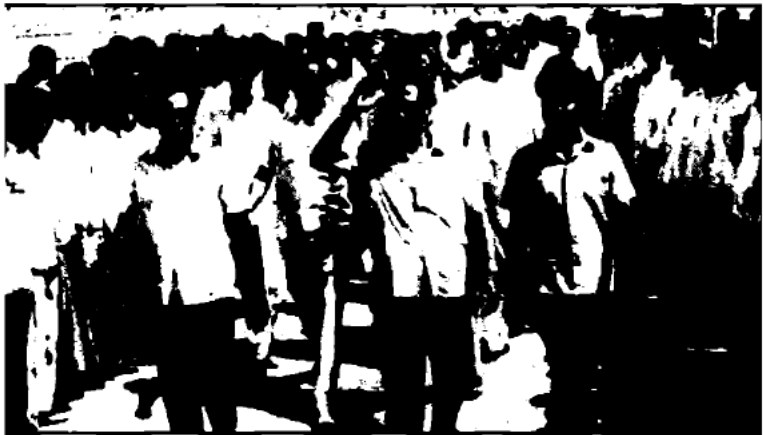
মুক্তিযোদ্ধাদের শিবিরে মার্চপাস্টে সালাম নিচ্ছেন যুদ্ধকালের প্রধানমন্ত্রী তাজউদ্দীন আহমদ