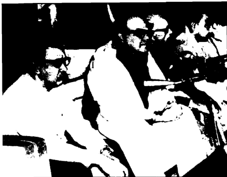
মুক্তিযুদ্ধে নেতৃত্বদানকারী চার নেতা: তাজউদ্দীন আহমদ, সৈয়দ নজরুল ইসলাম, এম. মনসুর আলী ও এ এইচ এম কামরুজ্জামান।

সৈয়দা জোহরা তাজউদ্দীন : Straight-cut policy.