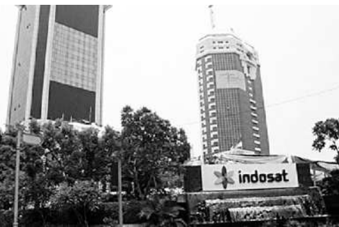
Menara gedung Indosat di Jakarta.

tokoh masyarakat, LSM dan agama. Bahkan, Kemkominfo melakukan deklarasi memerangi situs porno yang dinamakan Gema Insan atau Gerakan Masyarakat Internet Sehat dan Aman. Tapi sayang, belum memberikan perubahan maksimal terhadap pemblokiran situs tersebut. "Secara kuantitatif belum ada laporan lebih lanjut, tapi hampir 70 persen pemberantasan situs porno itu dilakukan," katanya. Untuk lebih memaksimalkan program pemblokiran, Gatot meminta masyarakat meningkatkan kerja samanya. Masyarakat diminta melaporkannya kepada Kemkominfo ketika ditemukan situs-situs porno terbaru. "Masyarakat jangan hanya hangat-hangat tahi ayam saja.