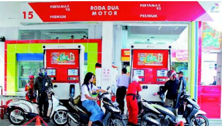
KESIBUKAN SPBU PERTAMINA: Aktivitas pengisian bahan bakar di SPBU Pertamina di Jalan MT Haryono, Jakarta, kemarin. Pertamina menjamin pasokan pertamax di seluruh Stasiun Pengisian Bahan Bakar Umum (SPBU) jika Pemerintah melakukan pembatasan penggunaan BBM bersubsidi jenis premium.