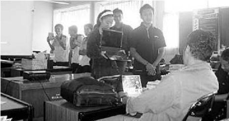
Kegiatan Program PC For Teacher yang dilakukan Axioo Indonesia.