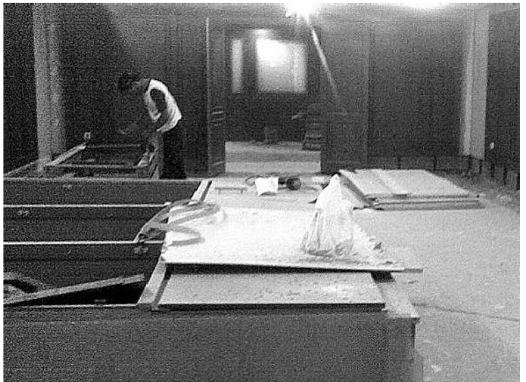
Ruang kerja Menteri Muhaimin dan ketua Satgas TKI sedang direnovasi. Mereka ngungsi ke kantor di Kalibata.