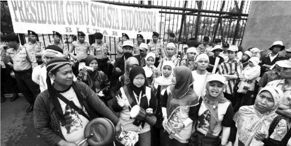
AKSI GURU NON PNS: Puluhan guru yang tergabung dalam Persatuan Guru Honorer Indonesia (PGHI) melakukan aksi unjuk rasa di depan Gedung DPR, Jakarta, kemarin. Mereka menuntut pemerintah dan DPR memperhatikan nasib guru honorer baik yang mengajar di sekolah negeri maupun swasta.

Selain menduduki kantor gubernur, Adi, menuturkan para aktivis juga akan menggelar aksi unjuk rasa di Kantor Total. Dia minta PT Total membuka diri. ■ EDY