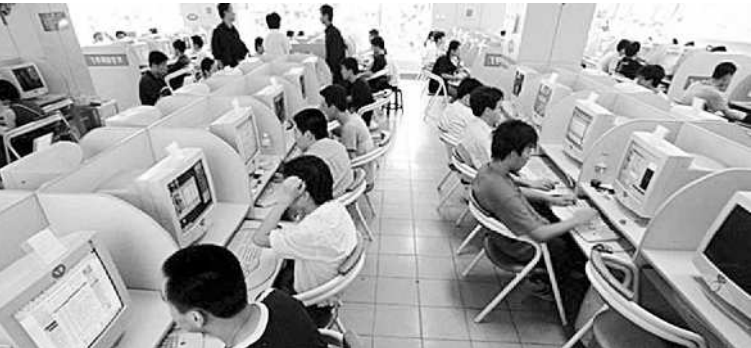
Masyarakat pengguna jasa layanan internet masih banyak yang mengakses situs porno.

meskipun laba bersih kuartal III turun dibandingkan periode yang sama tahun lalu. Selain Indosat, XL juga menghadirkan layanan VAS terbaru berupa layanan XL Music Live. Layanan ini disediakan XL bagi pelanggan untuk dapat mendengarkan berbagai pilihan musik sesuai channel atau kategori tertentu. Direktur Marketing XL Nicanor V Santiago menyatakan, penyediaan layanan ini merupakan wujud komitmen XL untuk selalu memberikan sesuatu yang baru bagi pelanggan dan diharapkan dapat memberikan tambahan pengalaman yang menyenangkan dalam menggunakan layanan seluler. "XL Music Live ini diharapkan bisa menjadi jawaban atas semakin meningkatnya kebutuhan pelanggan terhadap kemudahan dalam mengakses dan mendengarkan musik tanpa dibatasi spesifikasi tertentu dari perangkat ponsel yang dimilikinya," tandasnya. ■ FIK