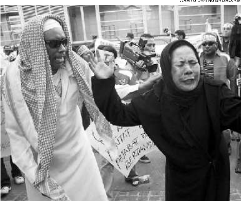
Sejumlah aktivis yang tergabung dalam Komite Independen Perlindungan Tenaga Kerja Indonesia (KORPS-TKI) demo di depan kantor Kedubes Arab Saudi, Jakarta, Senin (22/11).

Kalau reaksi keluarga ya spontanitas, terharu, bercampur apalah. Apalagi ini mendengar berita kematian, jadi sedih saja. Apa keluarga ikhlas? Iya, pada akhirnya ya sudah kita pasrah, dan mengikhlaskan beliau berpulang ke Rahmatullah . Mudah-mudahan dia mati syahid-lah di sisi Allah SWT. Diterima amal ibadahnya di sisi