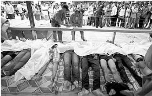
MAYAT BERGELIMPANGAN: Petugas medis mengecek nama-nama jenazah korban jembatan Kamboja, di Phnom Penh, kemarin.

Di Inggris, British Airport Authority menerima keluhan serupa. Juru bicara BAA mengatakan, pihaknya akan menindak jika ada stafnya yang berperilaku tidak pantas atas penyalahgunaan pemindai itu. Inggris memberlakukan pemindai bugil, Desember 2009. Paus Benedict XVI juga tak setuju dengan pemindai itu. “Perlindungan harga diri dan integritas manusia di atas segalanya,” kata Paus, Senin (22/2). ■ SMH/AP/EFL