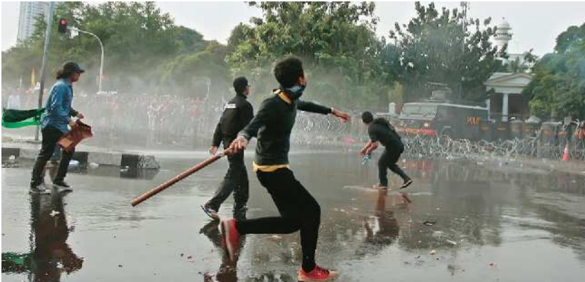
LEMPAR ISTANA: Sejumlah mahasiswa melempari aparat yang berjaga di depan Istana, dan dibalas dengan semprotan gas air mata, kemarin.