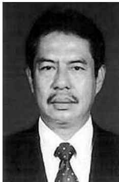
AS Rizal Asir

BADAN Pelaksanaan Kegiatan Usaha Hulu Minyak dan Gas Bumi (BP Migas) bersama Kontraktor Kontrak Kerja Sama (KKS) menyerahkan bantuan rekonstruksi bangunan umum pasca gempa Jawa Barat yang terjadi tahun 2009 senilai Rp 4 miliar lebih.