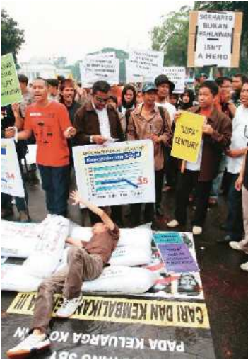
GULING ISTANA: Demonstran tidur-tiduran di atas guling yang dibawa ke depan Istana, kemarin.