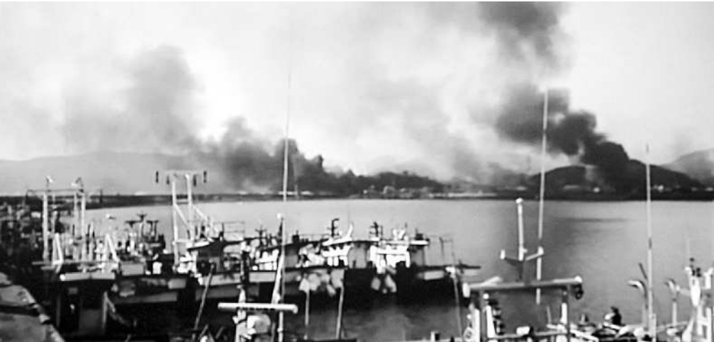
GELAP & MENCEKAM: Asap hitam menutupi wilayah udara Pulau Yeonpyeong, Korsel, setelah Korut membombardir wilayah itu, kemarin. Sebanyak 50 bom mortir Korut mendarat di Korsel.